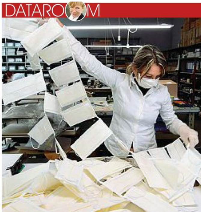
Un'officina di pelletteria di Vigevano trasformata in una fabbrica di mascherine